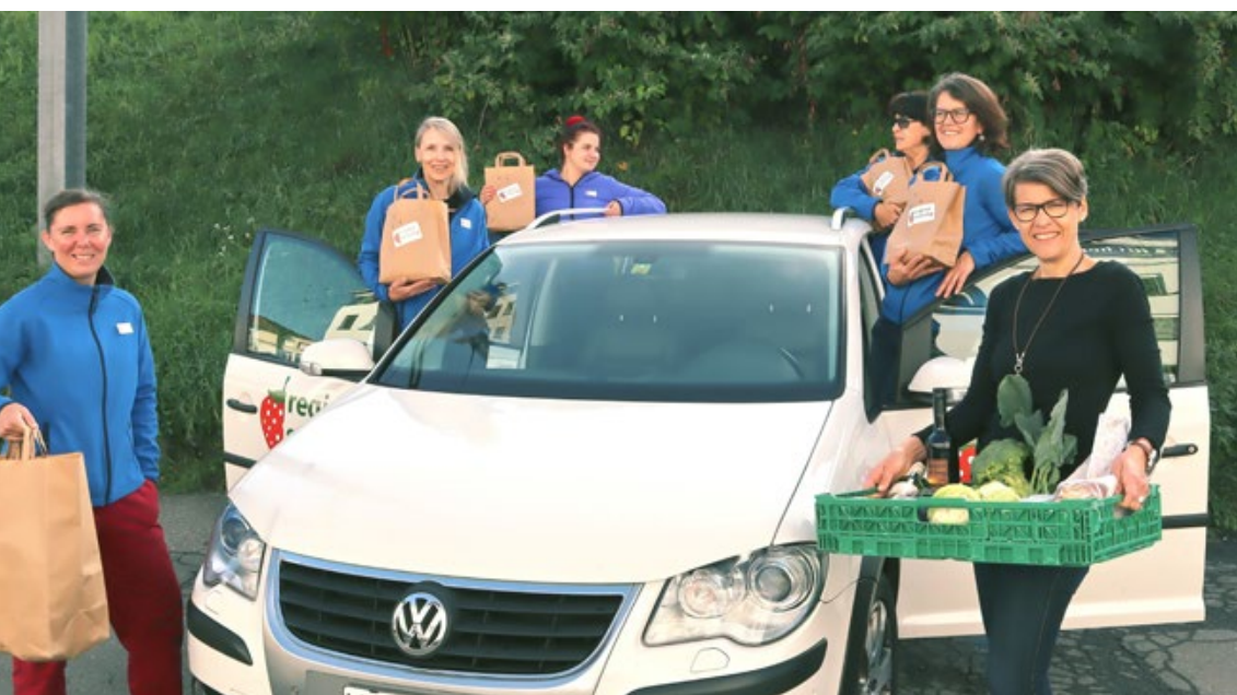
L'équipe du service de livraison du Seetal apporte des produits régionaux à domicile.

Beeyo Sàrl a développé une plateforme en ligne sur laquelle 50 productrices et producteurs vendent actuellement quelque 450 aliments et objets. La clientèle peut à tout moment passer commande sur cette plateforme très facile à utiliser. Les productrices régionales et producteurs régionaux disposent ainsi d'un canal de vente supplémentaire, tandis que les clientes et clients bénéficient d'un service de livraison rapide. Ce dernier couvre un rayon raisonnable afin d'approvisionner chacune et chacun en peu de temps. Lors de chaque commande, Beeyo récupère les matériaux à recycler de sa clientèle. Voilà qui soulage notamment les personnes à mobilité réduite qui ne sont plus capables d'aller jusqu'à la déchetterie.