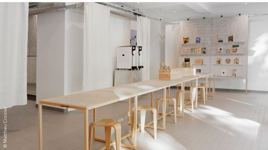
Intérieur du Deli Social.

Deli Social est un centre culinaire créatif situé à Lausanne. Combinant café, cuisine de test et boutique de magazines, Deli Social se présente comme un théâtre culinaire adaptable et expérimental. Ouvert du lundi au samedi de 9 h à 18 h, le lieu propose une carte saisonnière de sandwiches, tartines, pâtisseries, boissons non alcoolisées, thé et café. Il accueille en outre le programme de résidence culinaire Mise en Place . Les résident-es bénéficient du temps, de l'espace et des équipements nécessaires à l'avancement de leurs idées.