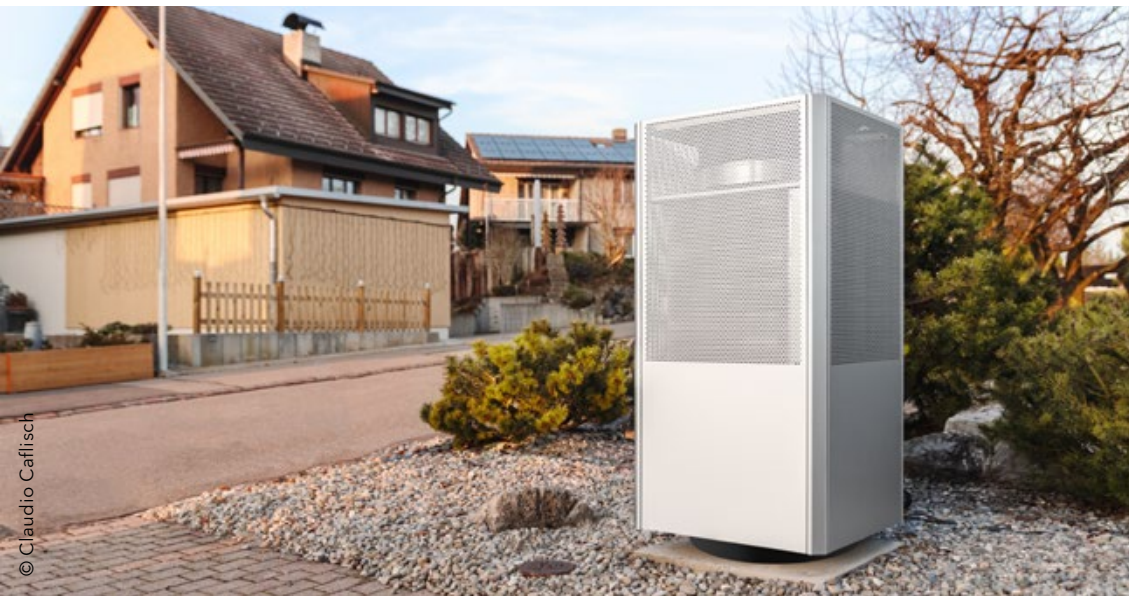
Modèle NovaAir 4-16 pour maison individuelle, Oberland zurichois.

Regli Energy Systems ambitionne de rendre plus durable et écologique le marché du chauffage traditionnel, en permettant aux pompes à chaleur d'atteindre leur plus grand potentiel sous l'angle de la durabilité. Après une longue période de recherche et de développement, le premier produit « NovaAir » est passé au centre de test des pompes à chaleur de la Haute école spécialisée de Suisse orientale. Dans plusieurs séries de mesures, il a reçu les meilleures notes en matière de performance et d'efficacité. Raison supplémentaire de se réjouir : ce résultat a été obtenu avec l'utilisation d'agents réfrigérants naturels, 700 fois plus écologiques que les fluides traditionnels encore présents dans la plupart des pompes à chaleur.