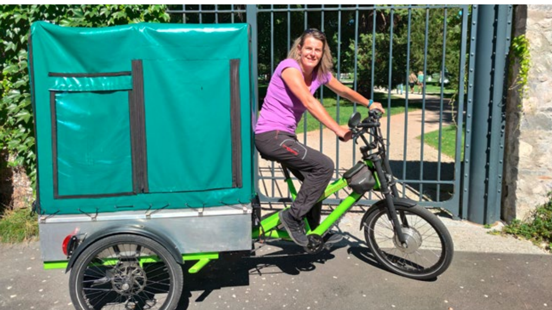
La micro-entreprise Cyclomoov livre la clientèle de karibou.ch.

Karibou.ch est un marché alimentaire numérique, accessible à tout le monde et à tout moment, qui redonne à l'alimentation la valeur qu'elle mérite. Depuis 2015, 60 productrices et producteurs de denrées alimentaires ainsi que des commerçant-e-s indépendant-e-s de la région genevoise ont rejoint la plateforme en ligne karibou.ch. L'objectif est de garantir une meilleure disponibilité de leurs produits. La vente directe élargie permet d'augmenter le chiffre d'affaires sans cannibaliser la présence physique des commerçant-e-s. Pour la clientèle, l'accès aux spécialistes de l'alimentation est facilité et se fait sans intermédiaire. Karibou.ch se charge de la logistique et livre les clientes et clients de la région genevoise en recourant à des services de livraison indépendants (exclusivement en vélo cargo), à la date voulue.