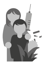
Santé et bien-être