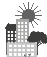
Habitat ou espace de travail durable