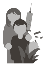
Santé et bien-être