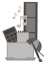
Formation et culture