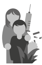
Santé et bien-être