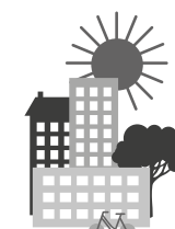
Habitat ou espace de travail durable