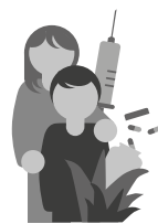
Santé et bien-être